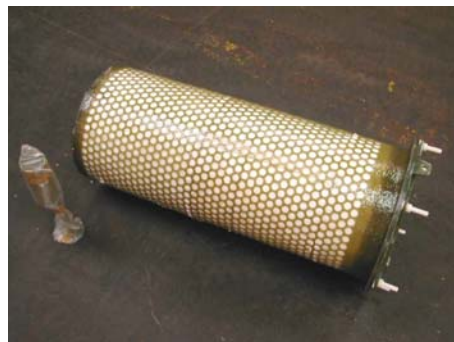
Мокрый фильтр для газообразного хлора со структурой GRP